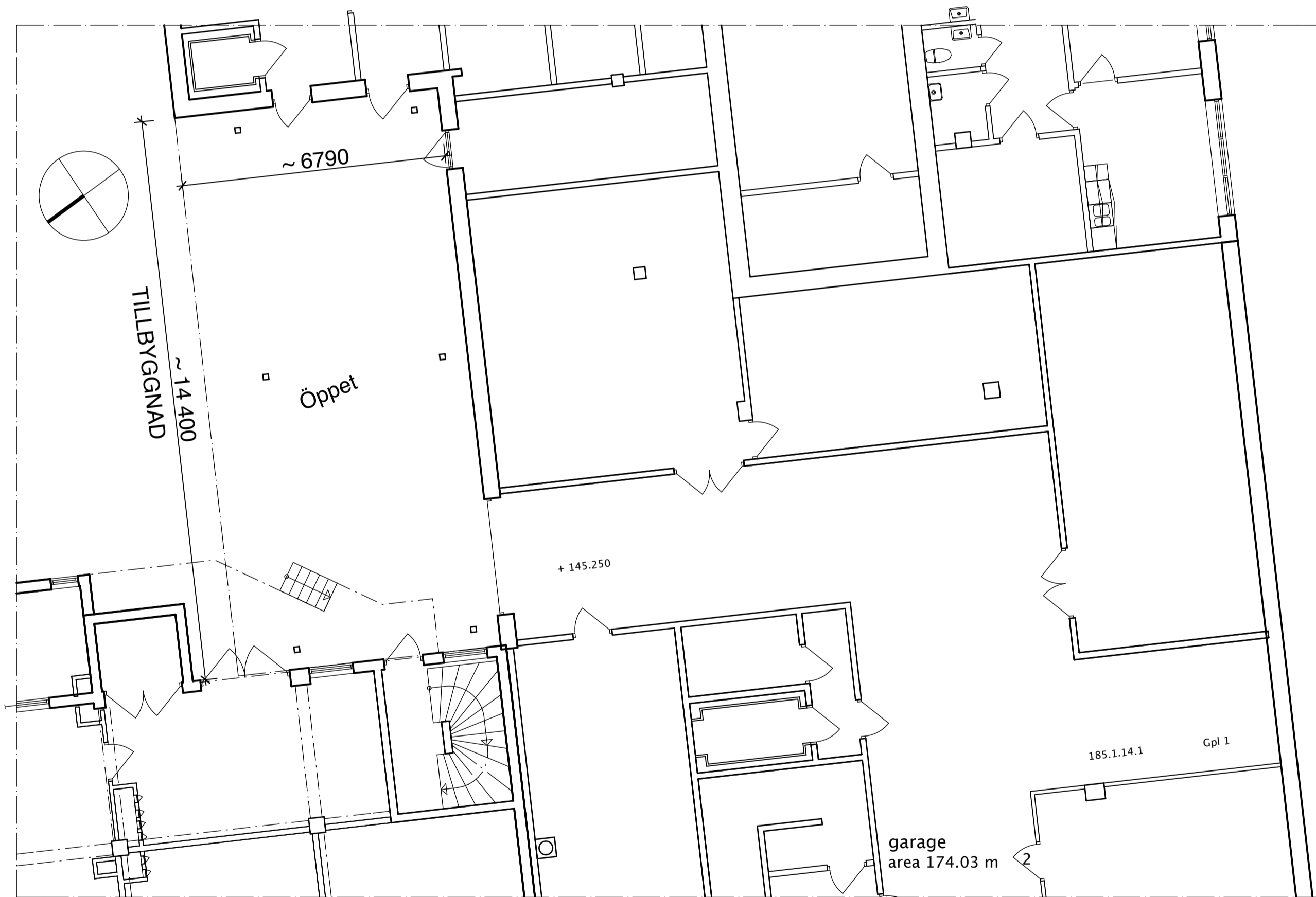
Plan 1 (markplan)